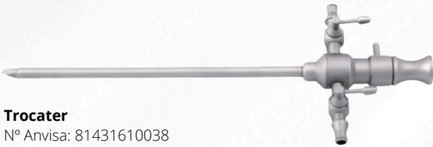
Trocater Nº Anvisa: 81431610038 Cód: G1101.3U Φ5 x 140mm